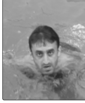
Karadeniz'in azgın sularından kurtulduğuna son derece memnun bir yazokulu sakini

Hep birlikte yaşamının keyfi bir başka oluyor. Her şeyden önce birbirimizi daha yakından tanıyoruz. Dostluklar, arkadaşlıklar doğuyor, bilenler bilmeyenlere anlatıyor, bilimsel bir birliktelik ve ruh hali doğuyor. Yani yazokullarının yararı sadece akademik açıdan değil.