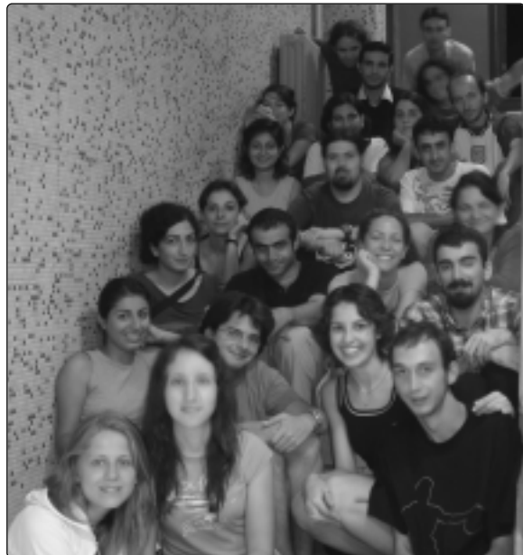
Bir grup öğrenci

Turistleri göbekatar, kendileri betonsever belki ama Amasralılar çok dürüst ve misafirperverler. "Garıla pazarı"ndaki hanım satıcılar dışında bizi kazıklamaya çalışan olmadı (böğürtlen reçelleri deniz manzaralı galiba!) ve yazokulumuz boyunca herkesten de büyük yardım gördük. Amasra'ya ve Amasralılara çok teşekkürler. ♥