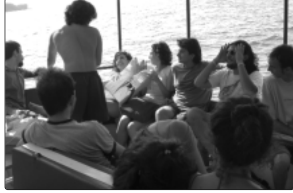
Bir tatil günü. O sabah da üç saat ders yaptık!

Cumartesi pazar demeden her gün ders yapılır. Öğrenciler çok yorulduğunda ve yakınmalar ayyuka çıktığında bir gün ara verilir, ki bu aşağı yukarı 15 günde bir olur. O günlerde toplu olarak piknik, orman yürüyüşü, plaj sefası, yat gezisinde elle tutuşarak istifrag gibi türlü etkinlikler yaparız.