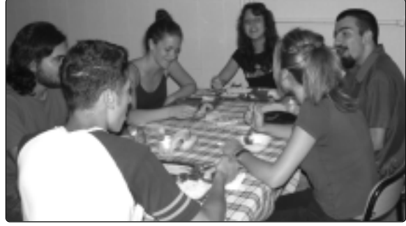
Amasra Otelcilik Okulu'nun Uygulama Otel'i'nde kaldık. Sabah ve akşam orada yenildi.

Dersler. Önce benim verdiğim derslerden başlayayım. Daha çok lisansın ilk yıllarındaki öğrencilere hitap eden ve olabildiğince standart olmamasına çalıştığım analiz ve soyut cebir dersleri dışında, herhangi bir cisim üzerine "bilinear, symmetric/hermitian, nondegenerate" formları (yani bir