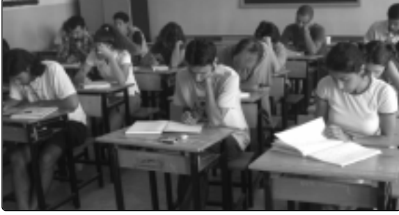
Bunlar konu mankenleri değil. Gerçekten düşünen öğrenciler.

8 yıldan beri her yaz İstanbul Bilgi Üniversitesi matematik öğrencileriyle 6-7 hafta süren bir yazokulu yapıyoruz. Her seferinde bir başka yere, mümkünse deniz kıyısında ve hoş zaman geçirebileceğimiz bir beldeye gideriz.