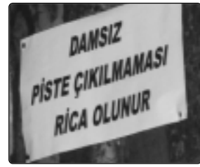
Yakında damsızlara kız da verilmeyecek!

Amasra'nın tek diskoteğine damsız girmek oldukça zor. Tecrübeyle sabit olduğu üzere, "Damım olsa burda ne işim var?" bahanesi ters tepbiliyor.