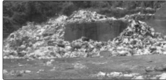
Amasra sahilinde ve olağanüstü bir doğa içinde akıllara durgunluk veren bir görüntü ve fotoğrafta çıkmayan dayanılmaz bir koku. Vişne reçeli kıvamındaki çöplüközü nazlı nazlı denize akıyor. Sadece çocuk değil, akli başında görünenteler de hemen o sahilden denize giriyorlar. Amasra'da boş arsalar benzer şekilde değerlendiriliyor.