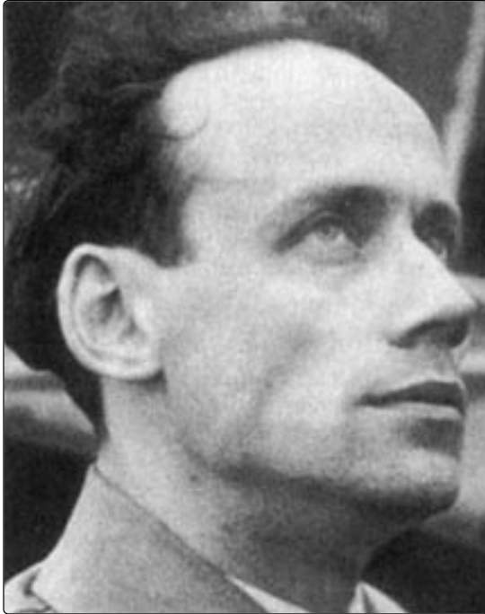
Lang'ın doktora hocası Emil Artin