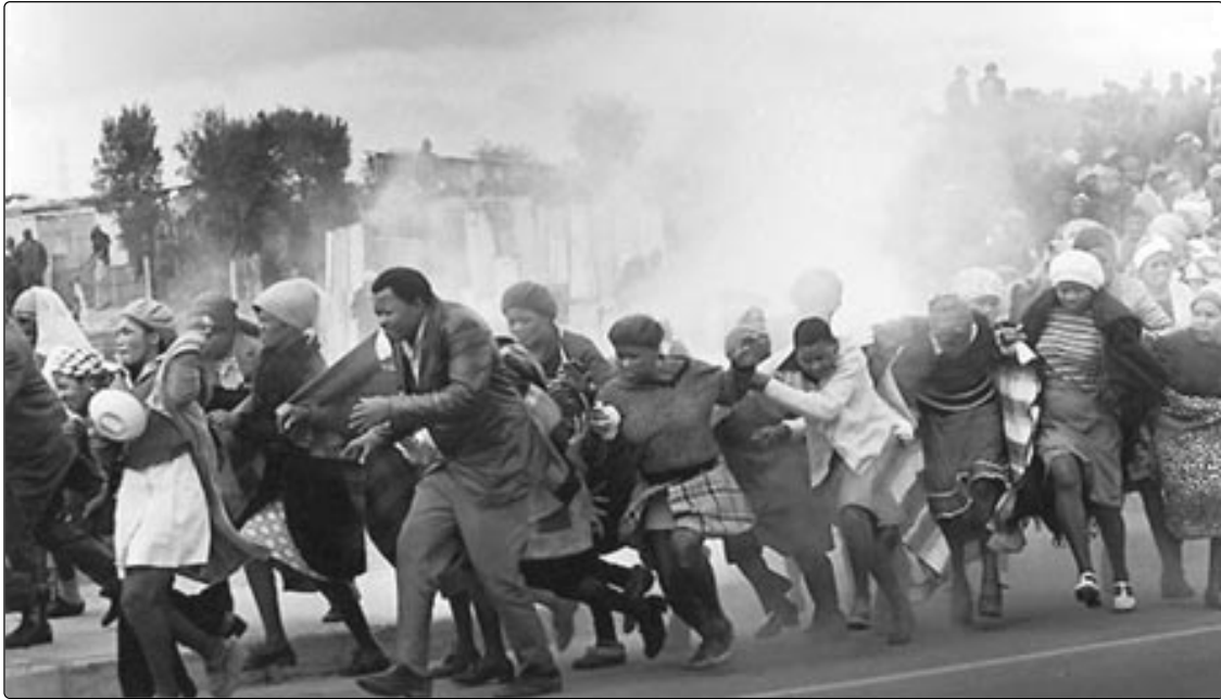
Huntington'ın "mutlu toplum" diye nitelediği Güney Afrika Cumhuriyeti'nden bir sahne. Yıl 1977. Evlerinin yıkılmasını potesto eden zencilere polis gözyaşartıcı bombayla yanıt veriyor.