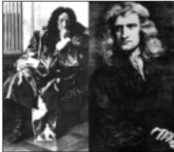
Leibniz ve Newton

Newton'un türev ve integral kavramlarını Leibniz'ten önce bulduğu kesin. Ancak genel kanı Leibniz'in aynı kavramları Newton'dan bağımsız olarak bulduğu yönünde. Öncelik tartışması bayağı