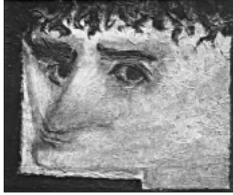
Bedri Rahmi, otoportre

Sen benim saz benizli, uzun saçlı, mahzun kardeşim, sen bir orta okul talebesisin, ya bütünleymeyle ikiden üçe geçmiş, yahut üçte matematikten çakmak üzeresin. Faruk Nafiz vari şiirler yazarsın.