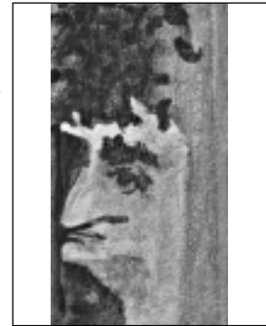
Bedri Rahmi, otoportre

Peki ya bu sivilcelere ne buyrulur? Gelir gelir de insanın tam suratının ortasına nişan alır bu münasebetsiz şeyler. Niçin insanın dizinde çıkmazlar da yüzünde çıkarlar? Bunlardan kurtulmak için neler feda etmeğe hazırsın. Sivilce bahsi hayatında mühim bir yer tutar. O zamana kadar nereden geldiğini pek iyi kestiremediğin hüznün bu münasebetsizlerin yardımıyla kasvete döner, ağlamaklı olursun. Yalnızken gök yüzüne, yıldızlara bakar, durup dururken ağlarsın.