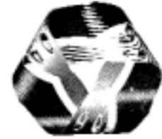
Escher'den bir yapıt

ve daha pek çokları Euclid ötesi geometrilerin, Gödel'in, Heisenberg'in, Schrödinger'in evrenlerinden etkilenmiş ve bu evrenlere kendi alanlarından derin sondajlar gerçekleştirmişlerdir.