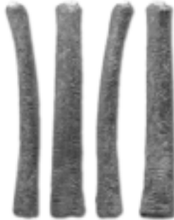
Üstündeki çentiklerden sayı saymaya yaradığı anlaşılan Ishango kemiği.

Bugün adlarını bilmesek ve elimizdeki kanıtlar sınırlı olsa da, araştırmalar yoğunlaştıkça, günümüzden 5000 yıl öncesinden başlayarak soyut matematiksel düşünceye ait kavramlar Nil boyunca eski Mısır'da, Mezopotamya'nın Sümer ve Babil'inde ve Hindistan'ın İndüs Vadisi'nde Mohenjo Dara ve Harappa gibi merkezlerde gelişmeye başlamıştır. İ.Ö.1200'lü yıllardan başlayarak ve özellikle Hindu'ların antik Sulba-Sutras kitaplarında Pythagoras ve Euclid'in çalışmalarının hemen tüm