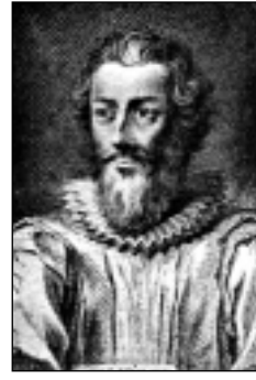
Pierre de Fermat

c) Türevle entegral arasındaki, bugün "Kalkülüsün Temel Teoremi" dediğimiz, ilişkinin Newton (1643-1727) ve Leibniz (1646-1716) tarafından birbirinden bağımsız olarak bulunması: Böylelikle "Integral Calculus" doğacaktır. Bu da, o güne kadar kullanım alanı oldukça sınırlı olan matematiğin önünü açacak ve matematiği evrensel bir bilim konumuna getirecektir. Ayrıca, kalkülüsle beraber bilimsel fizik ve mühendislik bilimleri de doğacaktır. Türevden önce, diferansiyel denklem, dolayısıyla teorik fizik yoktu. Bir diferansiyel denklem, fiziki bir olayın matematiksel ifadesidir. Bu çalışmalar ve astronomideki gelişmeler matematiği başka bir düzeye, yeni bir döneme taşıyacaktı. ♣